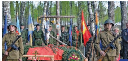
Встреча трех поколений