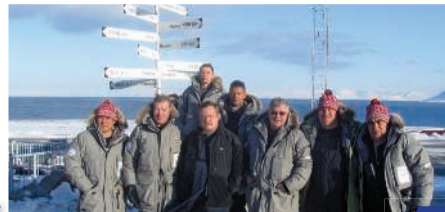
Десант на Северный полюс