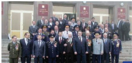
Ставропольская «Бахта Героев Отечества»